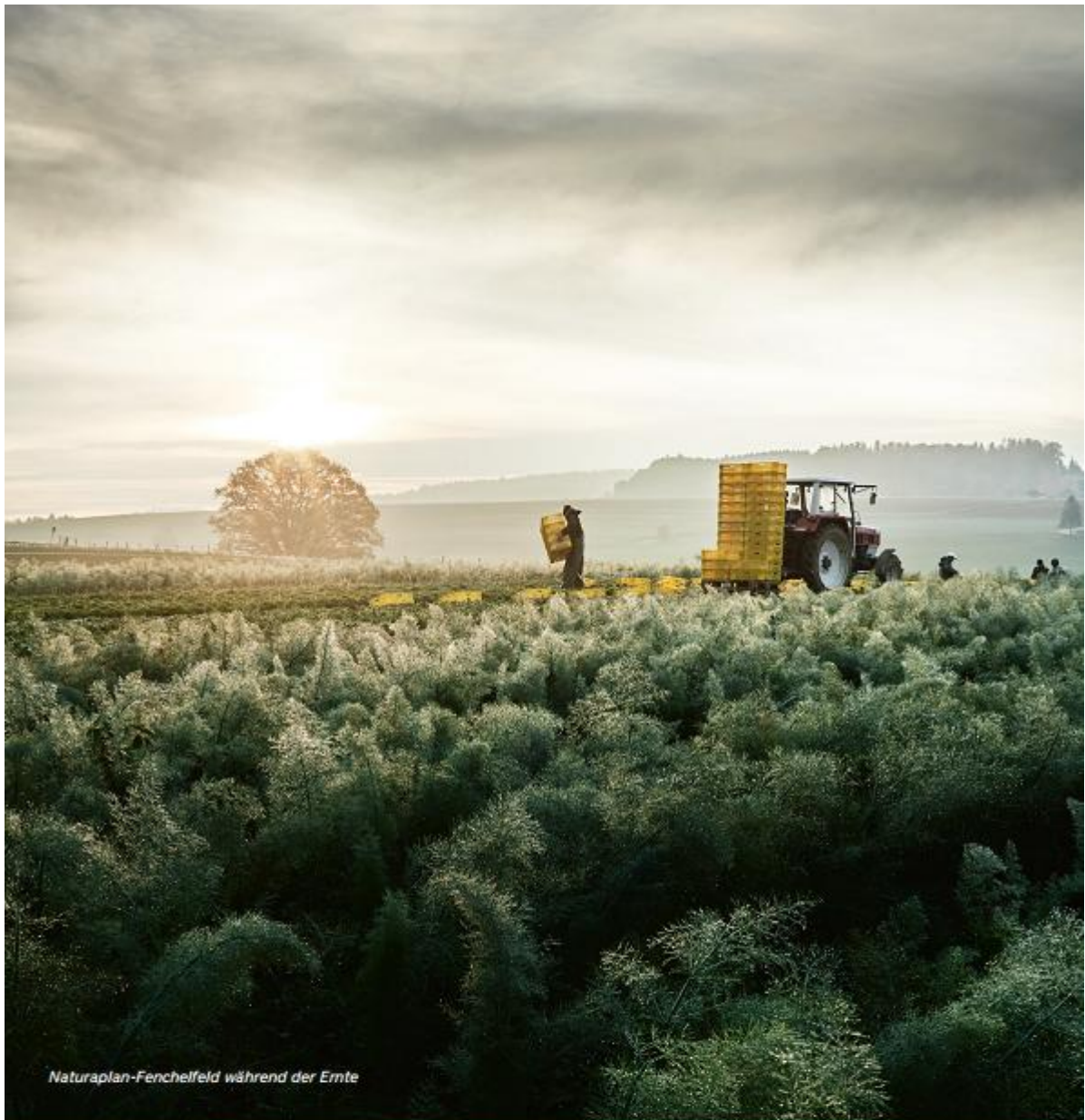
Naturaplan-Fenchelfeld während der Ernte