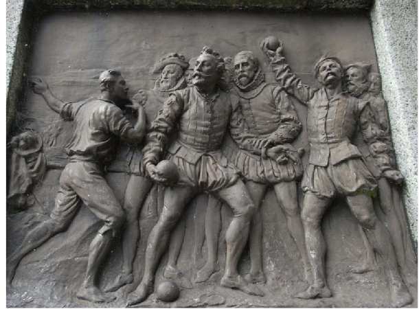
Sir Francis Drakes beim Bowls